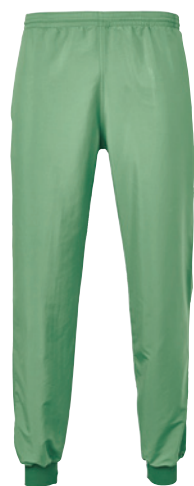
Pull-over et pantalon en Light-Tech REC