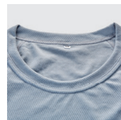
T-shirt en HT-REC