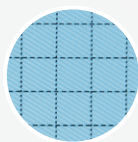
ION-NOSTAT VI.2 (bleu ciel)

Nous serions également heureux de vous fournir des cartes échantillons mentionnant les données techniques!