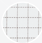
ION-NOSTAT VI.2 (blanc)