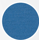
Light-Tech II (bleu)