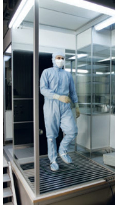
Qualifizierung von Reinraumbekleidung mit Hilfe der Body-Box-Methode