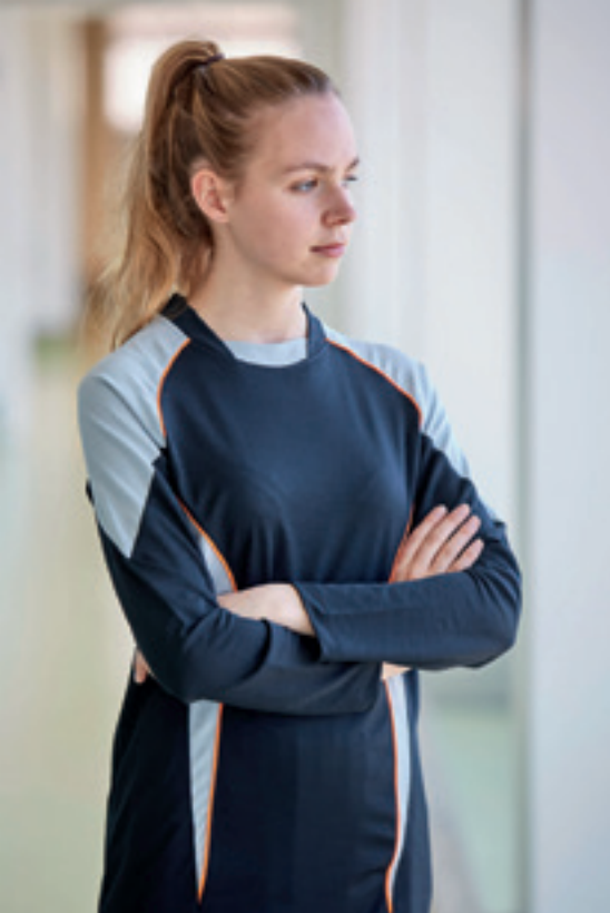
Reinraumtaugliche Zwischenbekleidung Funktionalität trifft Design!