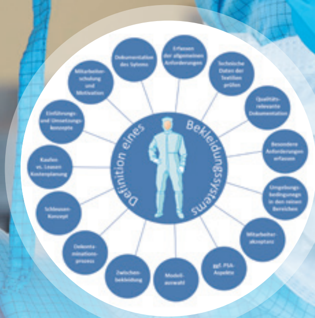
Abb. 1: Unterschiedliche Einflussfaktoren auf den Definitionsprozess: Reinraumbekleidungs-system

Alles wie gehabt oder sind Veränderungen zu erwarten?